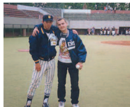
Зарубежные гости чувствовали себя на бейсбольном стадионе МГУ как дома